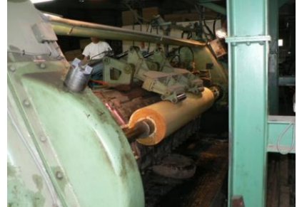
3 丸太の皮をむきます。