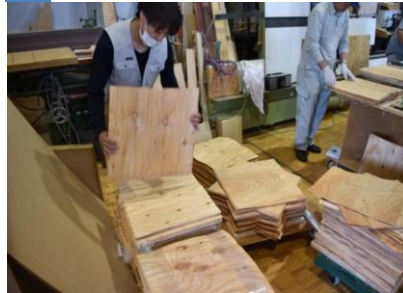
5 必要な大きさに切り揃えます。