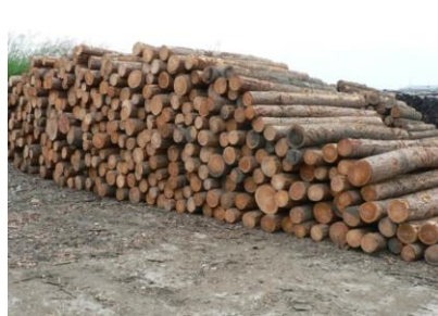
2 枝などを切落し、丸太にします。