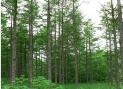
1 唐松を伐採します。