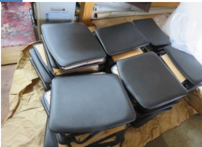
10 背板と座板にレザークッションを取付けます。