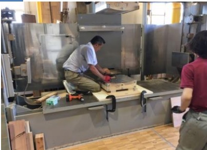
7 高周波プレス機に型をセットします。