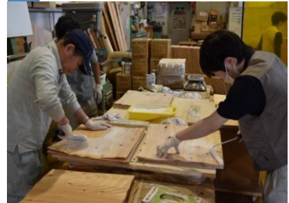
6 手作業で糊を塗り、十数枚を重ね合わせます。