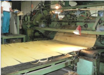
4 厚さ1mm程にスライスします。