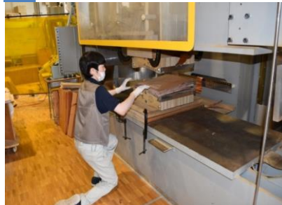
8 プレスして、接着と成型をします。